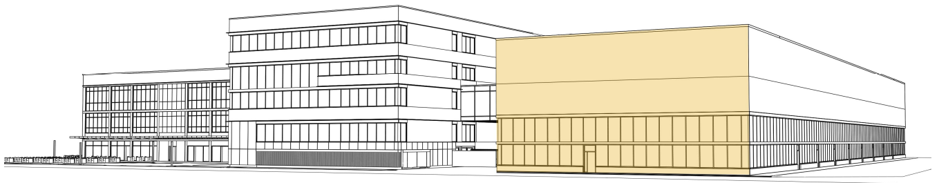
Standort A - Fassade X-Bau